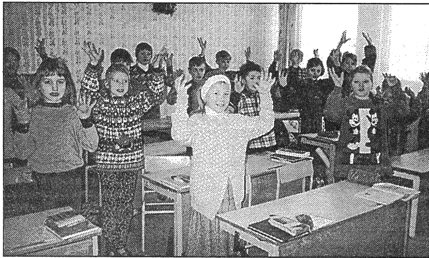
● 2. klases skolēni dziedot izvingrina nogurušos pirkstiņus.