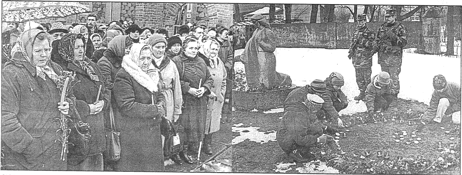
● 25. marts — komunistiskā terora upuru piemiņas diena, neskatoties uz nemīlīgo laiku, pulcināja bijušos politiski nepamatoti represētos no visiem rajona pagastiem. Tā sākās ar svinīgu pieņemšanu rajona padomē un noslēdzās ar mītiņu pie Preiļu katoļu baznīcas. Materiālu par komunistiskā terora upuru piemiņas dienas pasākumiem Preiļos un Līvānos lasiet 2. lappusē.