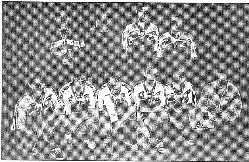
● SCO komanda — Preiļu pilsētas 1999. gada minifutbola čempionāta uzvarētāja.