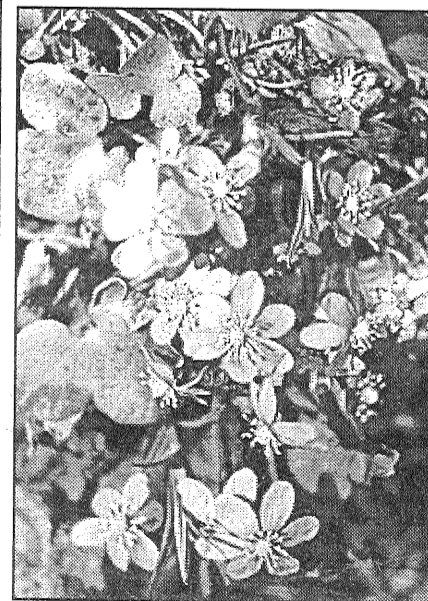
● Zied vizbulītes.

Pārdot jeb iznomāt šādus aparātus īpašnieki nav tiesīgi.