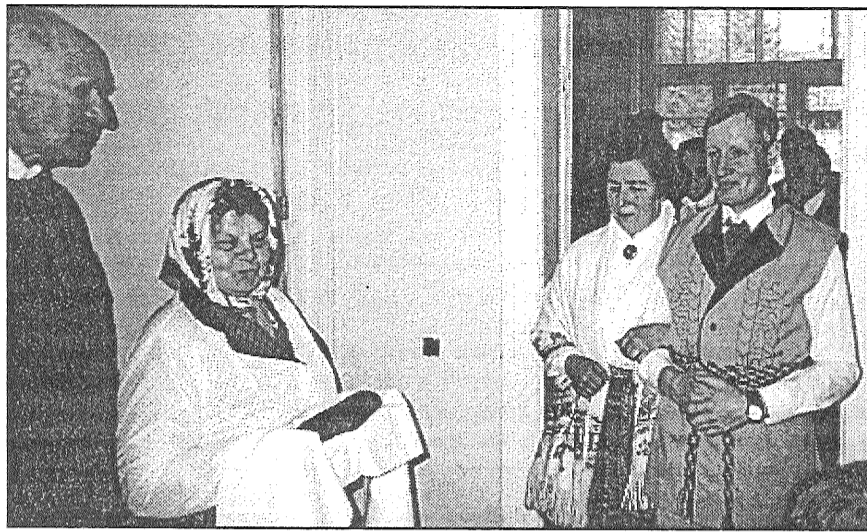
● Skats no Jersikas pagasta pensionāru sagatavotās izrādes «Kōzas».