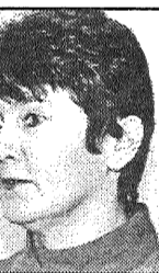
L. Kirillova J. Silicka foto