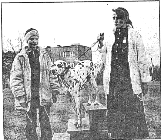
● Sanitas Bogdanovas demonstrētā Fane izpelnījās skatītāju simpātiju titulu.

Bez ievēribas nepalika neviens suns, jo par balvām rūpējās sponsors — Upmalas veterinārā aptieka. Mīluļiem tika dāvināti speciāli šampūni un suņu barība, ikvienam