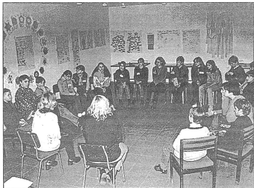
● Kas cilvēku ietekmē, no kā viņš kļūst atkarīgs? Sabiedrība, draugi, apkārtējā vide, mode, ģimene, reklāma, loterija, konkursi, valsts politika... Pat pieaugušie nezinās nosaukt tik daudz lietu un iemeslu, kas cilvēkos veido atkarību. Bet nometnē «Atkarību profilakse» par to visu tiek pārrunāts, spriests un analizēts.