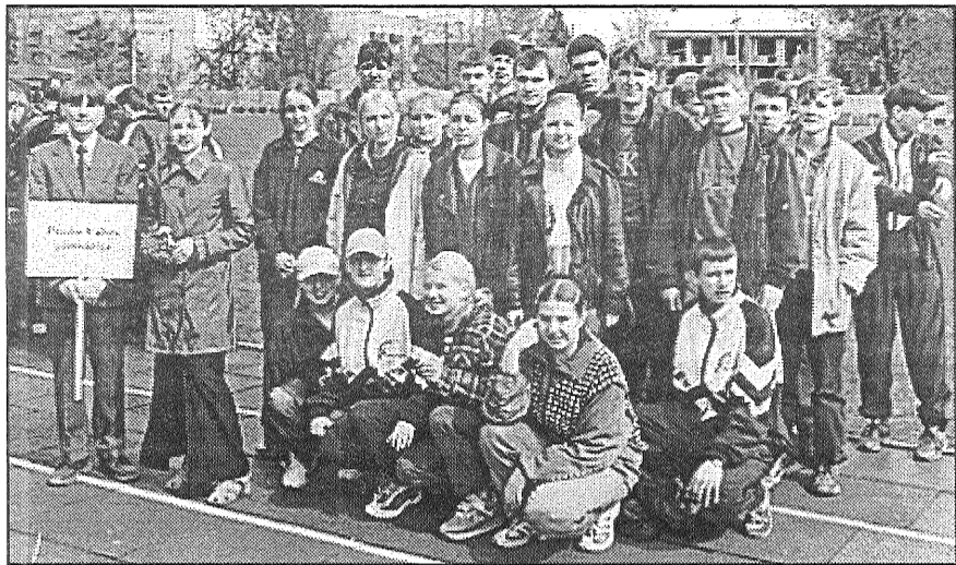
● Latvijas astoņu Valsts ģimnāziju spartakiādes atklāšanā komanda no Preiļu Valsts ģimnāzijas.