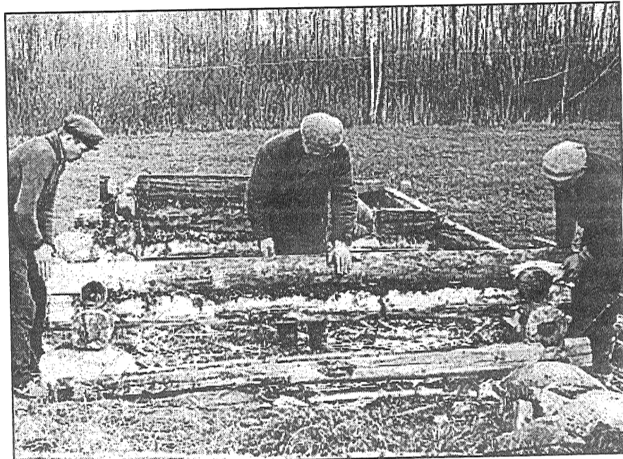
● Kolhoza celtniecības brigāde darbā, 50. gadi.

Reiz nolēmu vaktēt. Izlikos, ka aizgāju mājās, bet tad atgriezos atpakaļ, ielidzu netālu krūmos un vēroju. Jā, nāca Y ar lielu sienu grozu uz muguras it kā pēc malkas, kas viņam bija šķūņa galā. Vienā