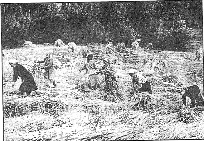
● Rudzu kūlišu siešana Kastirē, 50. gadu sākums.

Pavasara sēja pirmajā kolhoza pavasarī veicās labi, jo cilvēku bija daudz, lauki zināmi, sēklas pietiekami. Vēlāk sienu kaltējām, krāvām un ar zirgiem vedām šķūņos. Toreiz Feimankas un Dubnas liči bija ļoti labas dabiskās pļavas, siena pieauga daudz. Sienu krāvām arī uz lau-