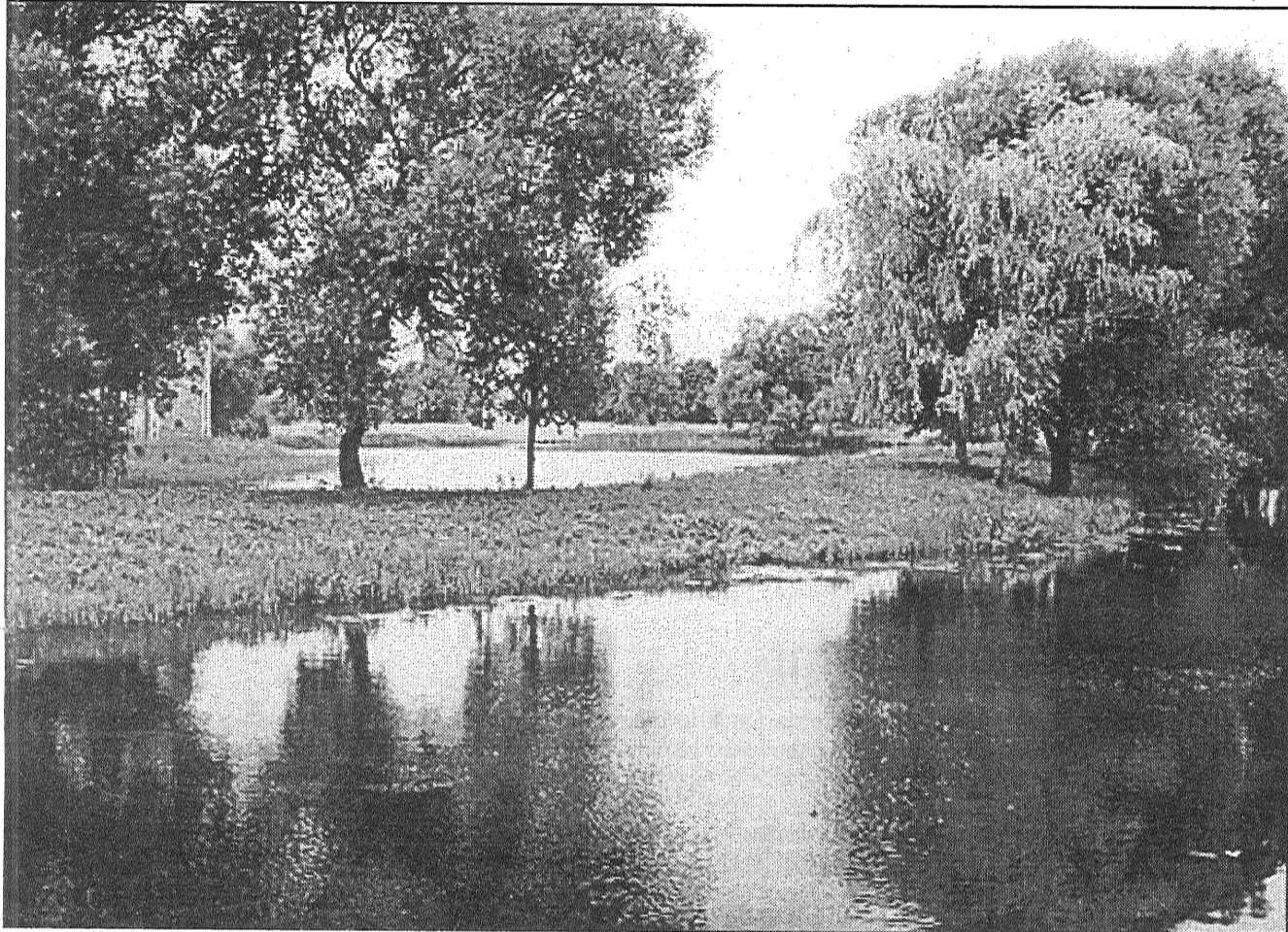
● Preiļu parkā.