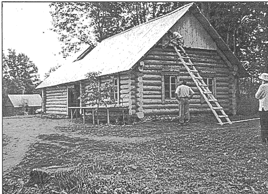
● Vēl dažas naglas un jaunā darbnīca varēs svinēt atklāšanu, uzņemt viesus.