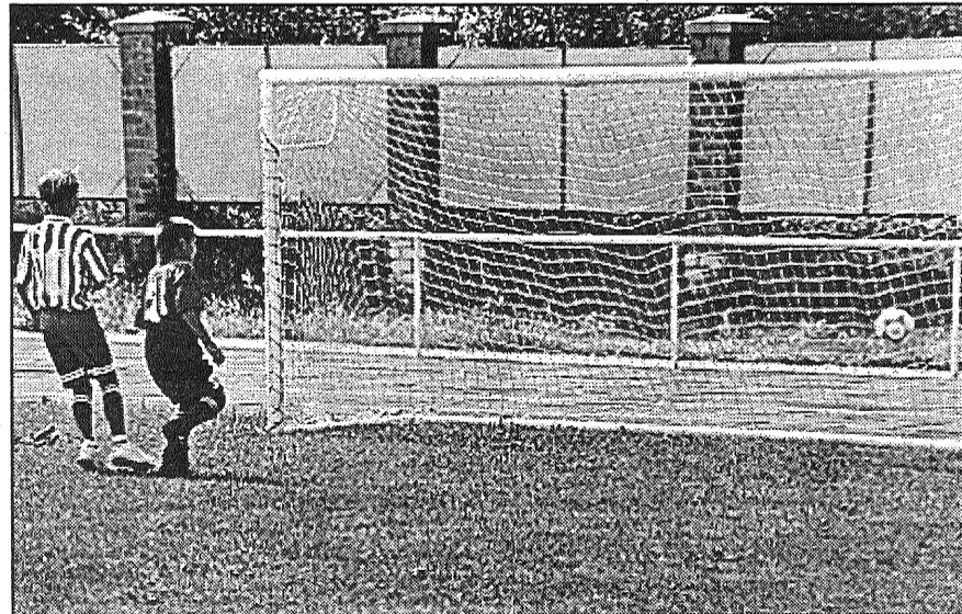
● Spēles moments, futbolisti no Balviem gūst vārtus, spēlējot ar Valmieras II komandu.