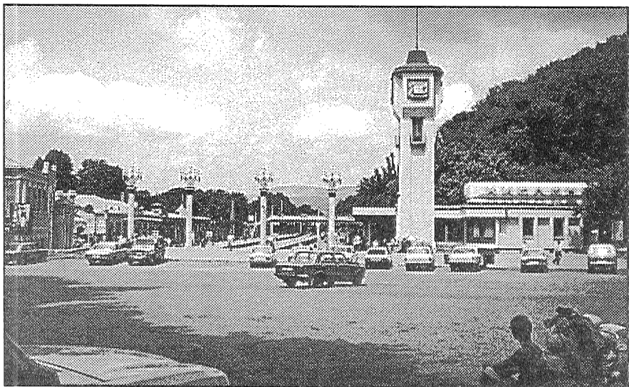
● Mājupceļā uzskavējamies skaistajā Kislovodskā.

No beigums. Sākums laikraksta 65., 67. un 69. numurā.