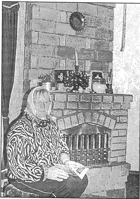
● Saimniecei patīk atpūsties pie kamīna.