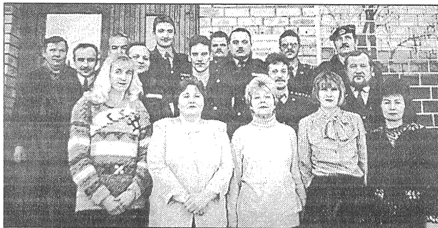
● Par drošību apsargājamajos objektos Līvānos un pilsētas apkārtnē rūpējas viss «Apsardzes» kolektīvs.