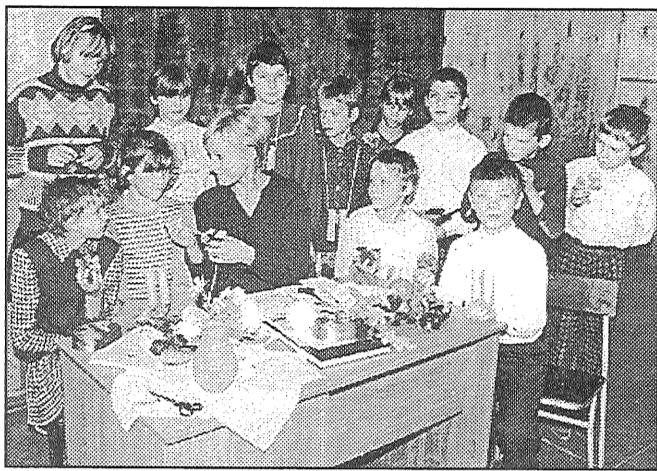
● Paša gatavotā rotaļlieta katram vismiļākā.