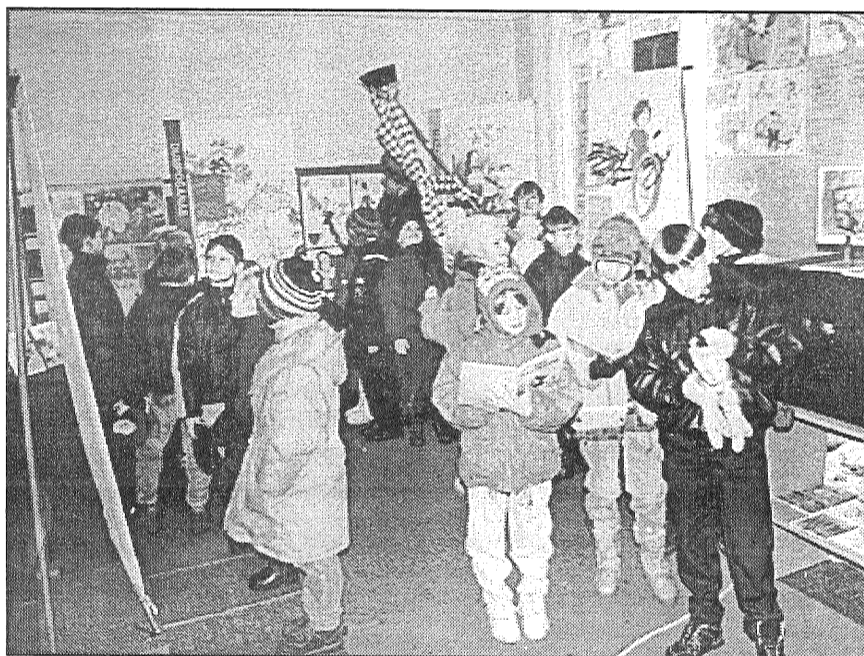
● Izstādi «Satiec bērnu» aplūkoja Preiļu 1. pamatskolas 2.b klase.

Jau kopš ilgāka laika Zviedrija tiek uzskatīta par pasaulē vadošo valsti bērnu kultūras un literatūras jomā, un šis ziemeļzemes rakstnieku darbus ir iemīļojuši arī lasītāji Latvijā. Sevišķi pēcpadomju laikos izdotas daudzas zviedru bērnu grāmatas, un tās vecāki saviem lolojumiem var dot bez raizēm. Jo tās patiesi bērnu māca tikai uz labu un kā galveno vērtību viņos attīsta humānismu. Izstāde parāda, kā zviedru bērnu