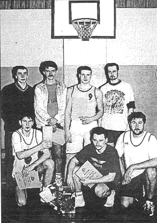
Starp vīriešu komandām uzvarēja «Arka».

5. februārī Līvānu ģimnāzijā notika Latgales novada BOCCIA turnīrs bērniem invalīdiem. BOCCIA ir komandas spēle, kurā piedalās 3 dalībnieki no katras komandas. Turnīrs norisinājās divās vecuma grupās: bērni vecumā no 8 līdz 13 un jaunieši vecumā no 14 līdz 19 gadiem.