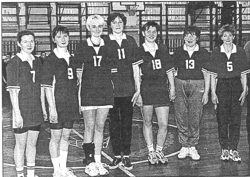
Basketbola zibensturnīra uzvarētāja — komanda «Dāmas».