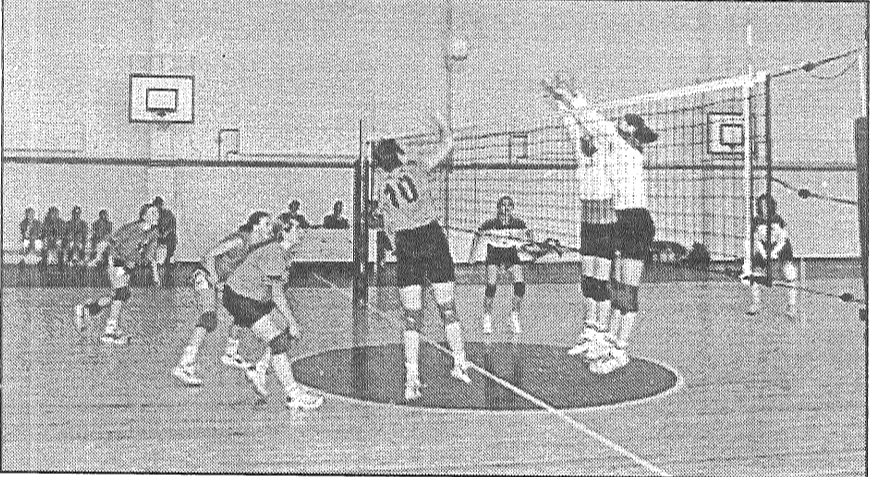
● Karstā cīņā starp Preiļu un Krimuldas volejbolistēm noskaidrojās cietinību pārspēks. Laukuma kreisajā pusē preilietes.