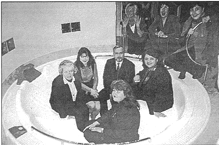
● Milzīgā vanna pagrabā tika ienesta pa daļām, bet montēta turpat uz vietas. Pirts kompleksā atrodas arī sauna un tvaika pirts 8-10 cilvēkiem, dušas, atpūtas telpa un neliela virtuvīte.

Likumdošana aizliedz privatizēt hidroelektrostacijas, kā arī elektropārvades tīklus, tie ir un paliks valsts rokās, apgalvoja premjers. Valsts saglabās monopoli, taču pavērs brīvu pieeju uzņēmējiem šajā nozarē, radīs konkurenci, elektroenerģijas cenu līmeņa krišanos. Analizējot «Latvenergo» privatizācijas jautājumu, Šķēle atzina, ka sociāldemokrāti jautājumu skata ļoti vienusēji. — Viņu viedoklis: «Latvenergo» jābūt vienotam, centralizētam, plaukstošam uzņēmumam ar peļņu 50 līdz 80 miljoni latu gadā. Skaisti, taču šie astoņdesmit miljoni ieka-