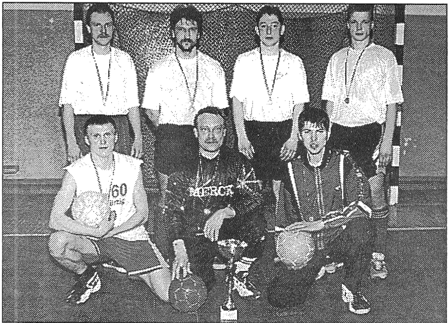
● Futbola čempionāta kausa ieguvēji — komanda «Namejs».