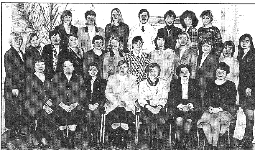
● Atbalsta grupu vadītāji ir gan medicīnas, gan izglītības, gan pašvaldības iestāžu darbinieki.