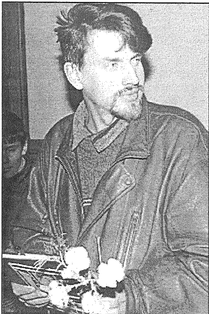
● Raimondam Valteram modeļu veidošana ir vaļasprieks. Maizes darbs viņam ir reklāmas veidošana un noformēšana.