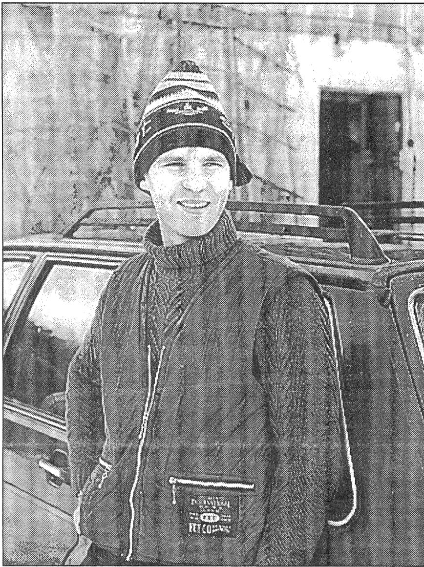
● Kamēr ģimene pilsētā, Aināram daudz darba mājās.