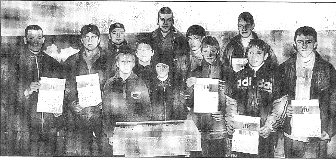
● Rajona skolu svaru bumbas celšanas sacensību uzvarētāji.