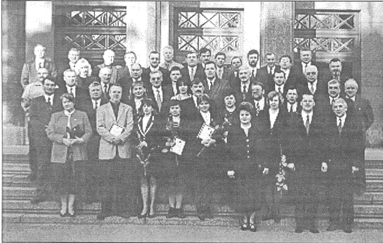
● Lielākie nodokļu maksātāji no Daugavpils pilsētas, Daugavpils, Preiļu un Krāslavas rajona.