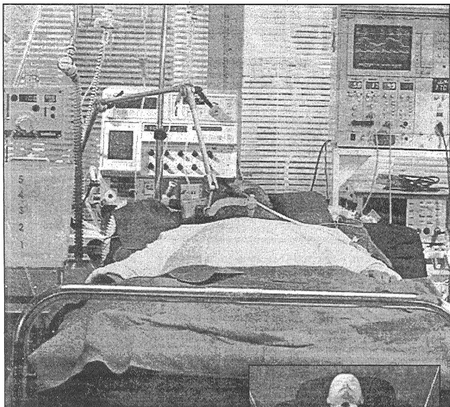
● Pacients nr. 0 ir ļoti līdzīgs eksponātam Mauzolejā.