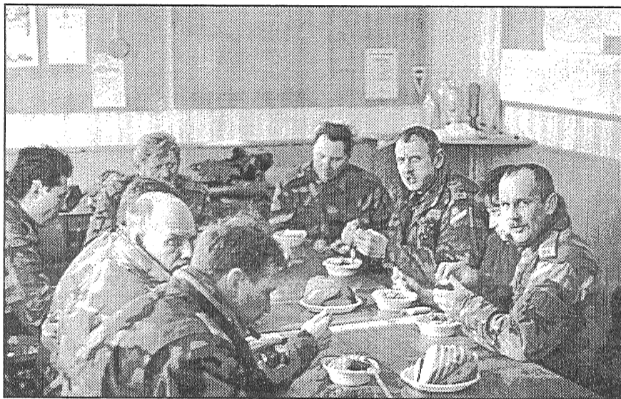
● Pēc krietna darba arī apetīte nav peļama.