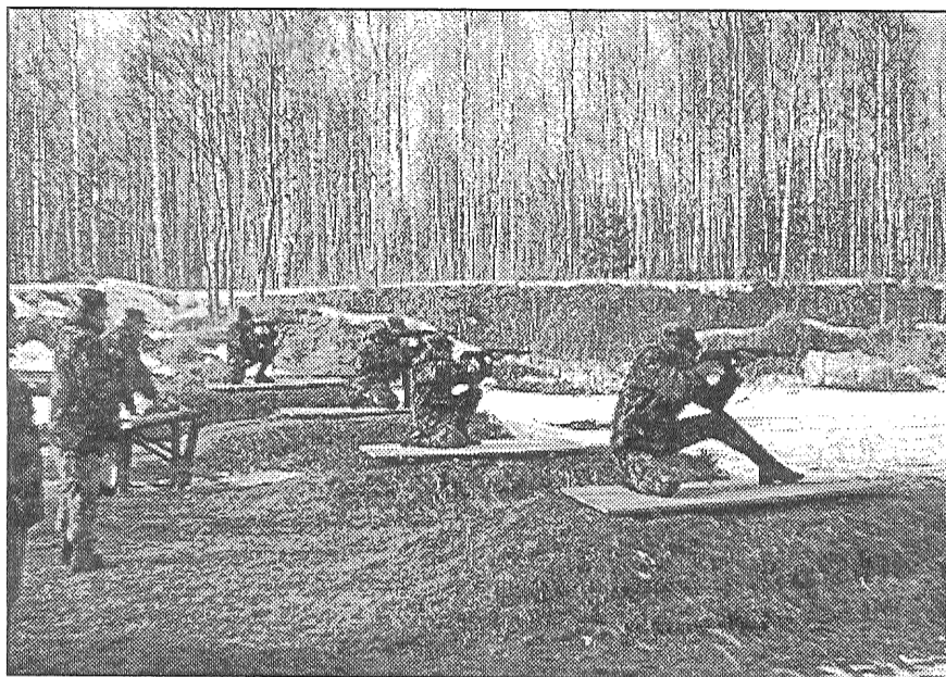
● Zemessargi ugunspozīcijā.

Tas bija desmit mācību dienu cikla sākums, kurā jāpiedalās ārrindniekiem. Vēl viņus tuvākajā nākotnē gaida citu ieroču apgūšana, lauka kaujas mācības ZS bataljona bāzē un pierobežā ar Rēzeknes 36. bataljona zemessargiem, mācības specialitātēs, reglamentu zināšanā, kaujas mācības vadu sastāvā, kaujas gatavības pārbaude un citas nodarbības. Jūnijā un augustā tās ilgs vairākas dienas. Paredzēta arī šaušana ar kaujas patronām.