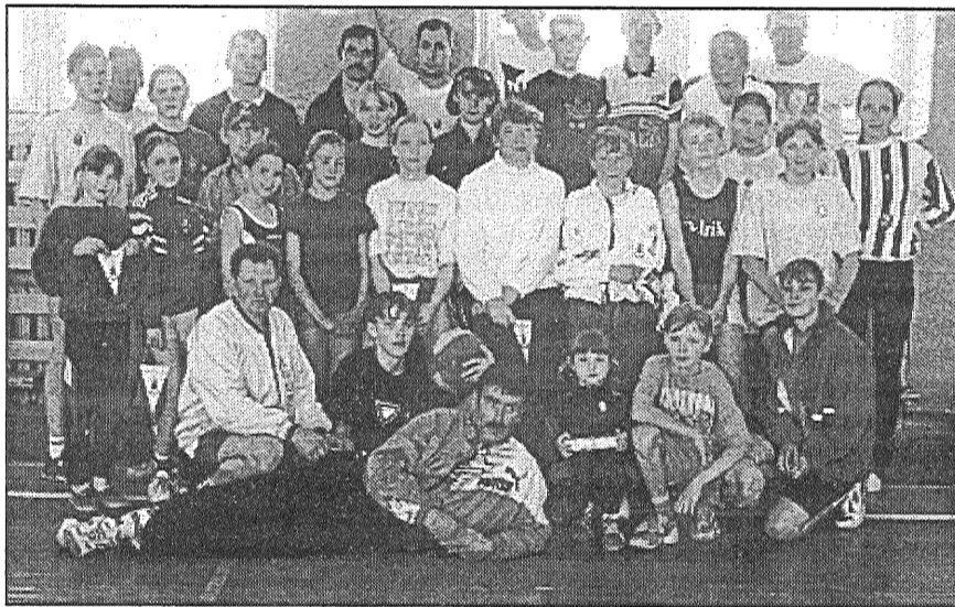
● Grupa ielu skrējiena uzvarētāju.