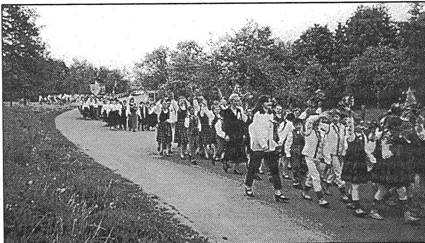
● Svētku dalībnieku gājiens pirmajos Livānu novada deju svētkos.