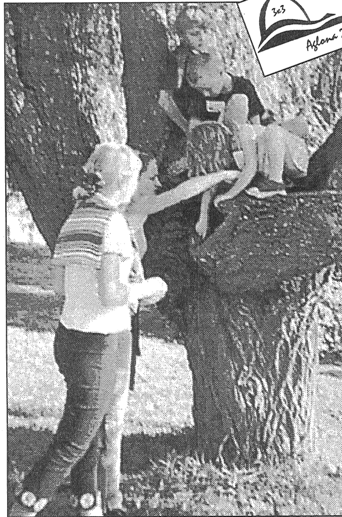
● Vispasaules latviešu nometnes «3 x 3» jaunākā un nerimtgākā paaudze. Kā putnēni viņi uz saviem vēl kuslajiem spārniņiem nesīs pasaulē Latvijas, Latgales, Aglonas vārdu.

Šovakar Aglonas vidusskolā valda īpaša noskaņa — klāt nometnes «3 x 3» noslēguma vakars ar pašu gatavotu koncertprogrammu un dančiem līdz pirmajiem gaiļiem. Tiek teikti pateicības vārdi visiem, kas nometni atbalstīja finansiāli un morāli: Preiļu rajona padomei, Aglonas pagasta padomei, Aglonas bazilikai, Aglonas vidusskolai, Aglonas pagasta ļaudīm un daudzajiem sponsoriem. Svētdien tiks nolaists nometnes karogs. Uz visām pasaules malām aizbrauks latvieši, kurus aizgājušo nedēļu ik vakarus vienoja šādi vārdi: