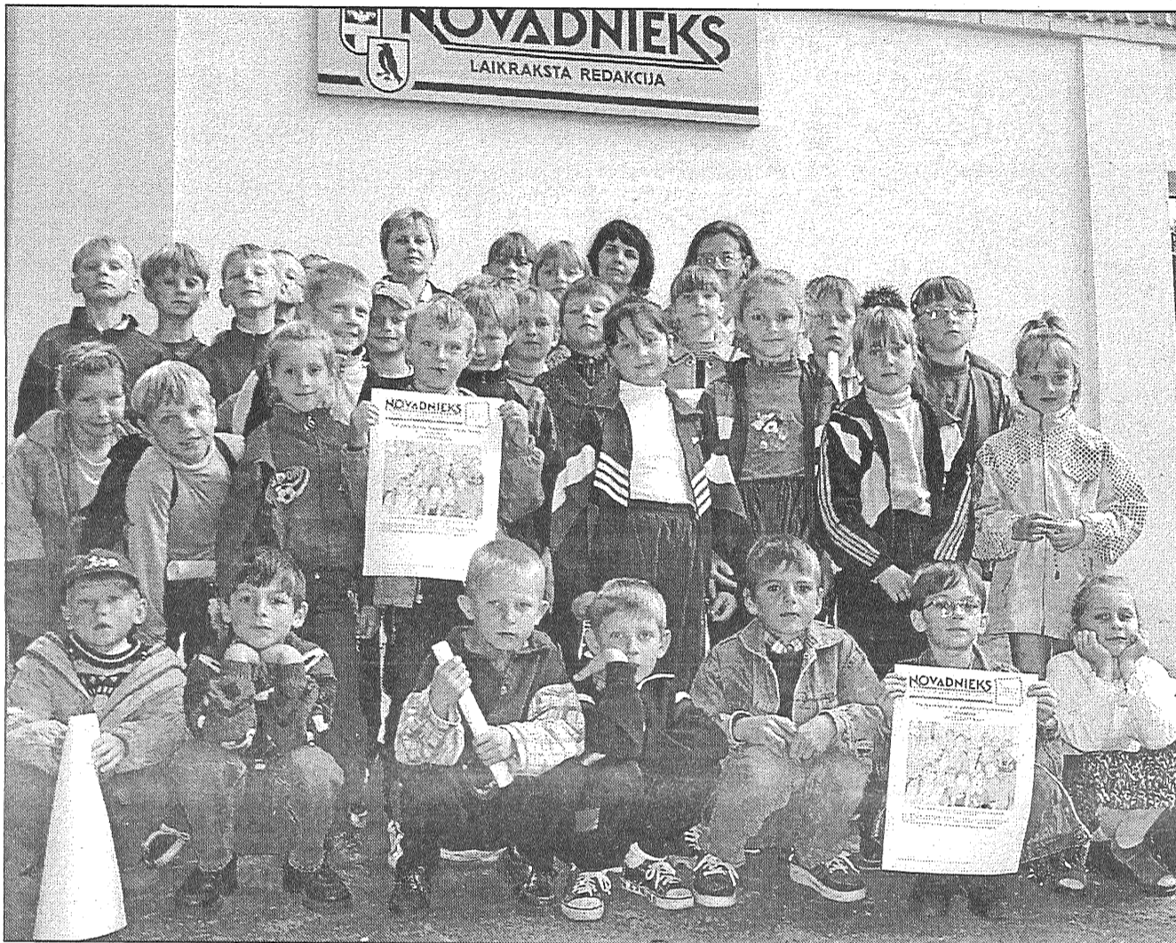
● Ceturtdien «Novadnieka» redakciju apmeklēja Riebiņu vidusskolas 2., 3. un 4. klases skolēni, lai iepazītos ar rajona laikraksta izgatavošanas jaunākajām tehnoloģijām.

«Novadnieku» oktobrim un pārējiem gada mēnešiem līdz 25. septembrim var pasūtīt visās pasta nodaļās.