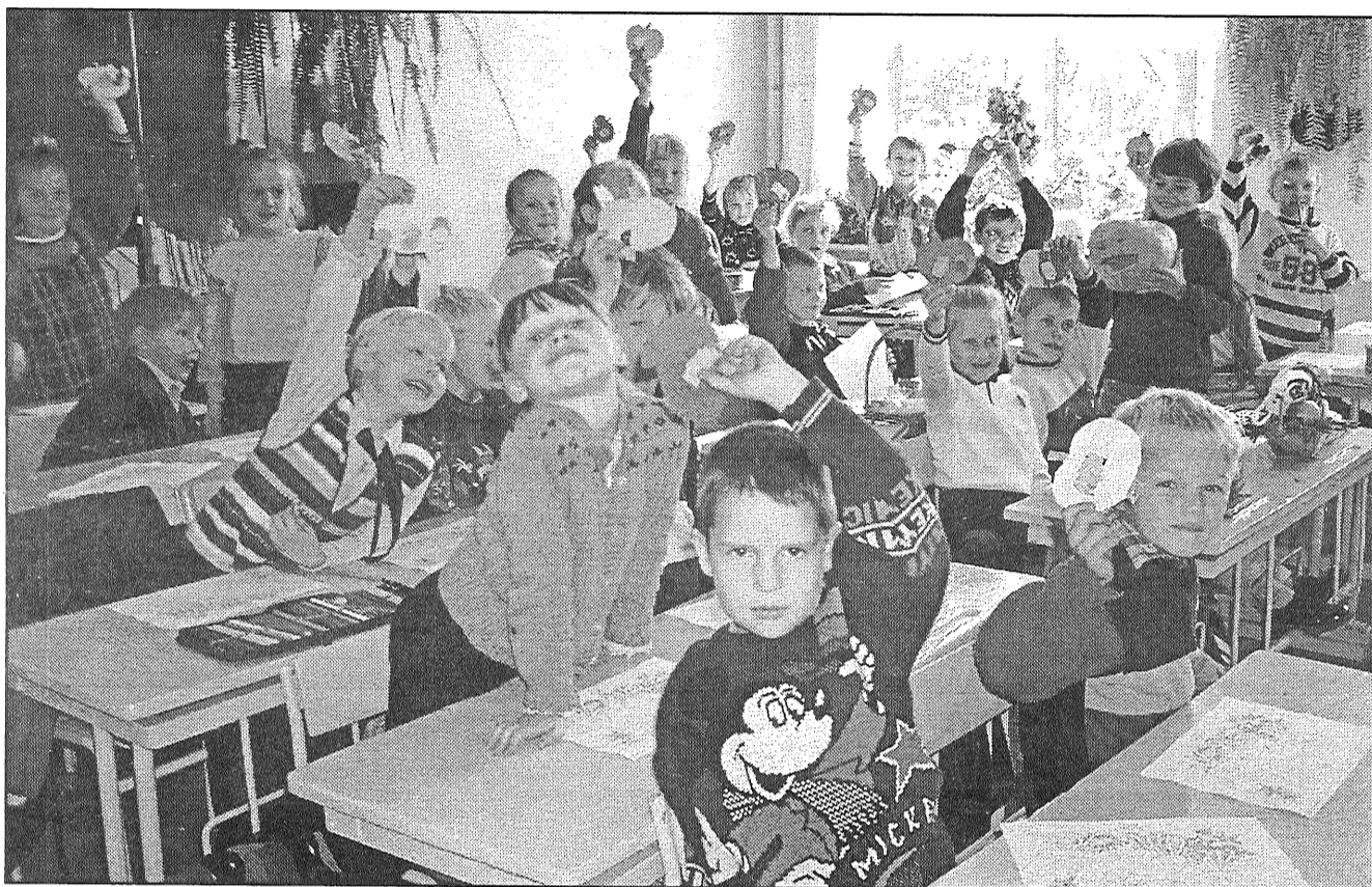
● Mums katram savs ābolītis, un katram ābolītim savs tārpiņš, — rāda Preiļu 1. pamatskolas 1.c klases skolēni.