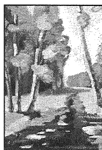
● Priestera A. Aglonieša šaržs (P. Gleizdāns) un ainava (J. Igovenšs).

šaubas un pārdzīvojumi, ikvienam kļūst skaidrs, kādēļ tapis katrs konkrēts darbs.