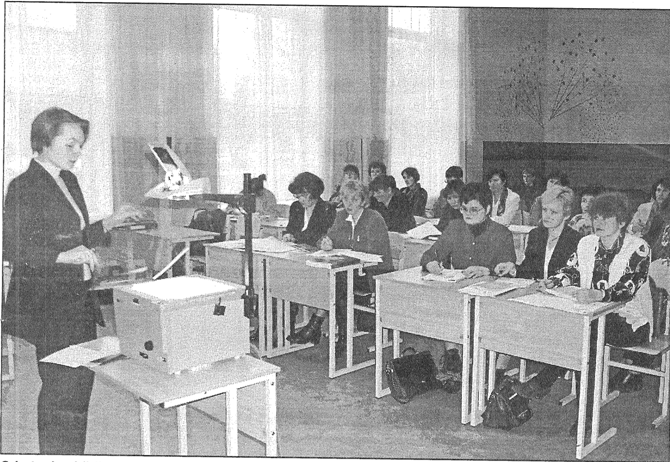
● Latgales bibliotekāri Preiļu Valsts ģimnāzijā tikās ar Eiropas integrācijas biroja pārstāvjiem.

Preiļos notika Latgales bibliotēku darbinieku un citu ieinteresētu cilvēku seminārs «Eiropas Savienība (ES). Informācijas avoti par Eiropas Savienību». To rīkoja Eiropas integrācijas birojs.