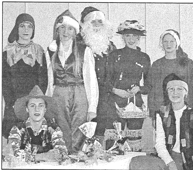
● Rūķu komanda. Viņi bija tik darbīgi, nu taisni kā dzelolīti: tie cēla, nesa, gādāja un traucās tik, cik spēja...

Bērni noskatījās rajona bērnu un jauniešu centra teātra grupas sagatavoto uzvedumu «Rūķu Ziemassvētki». Mazuļi kā dāvanīņu saņēmā Sieviešu kluba dalībnieču sarīpētās svečītes. Tās lielākoties bija viņu lietas. Sievietes cenšas, lai bērni saņemtu pašu rokām darinātas, miļas dāvanīņas. Pirmajā gadā kluba dalībnie-