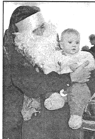
● Pašam bārdainākajam rūķim gādīgie papuciši sēdināja klēpī savus mazuļus un fotogrāfa ģimenes albumiem. Šim mazajam prellietim — mūžā pirmā Ziemassvētku eglīte.

ar ko rūķi devīgi cienāja bērņus, bija sagādāti par Preiļu domes un Sieviešu kluba līdzekļiem. Ģimenes, kam tas