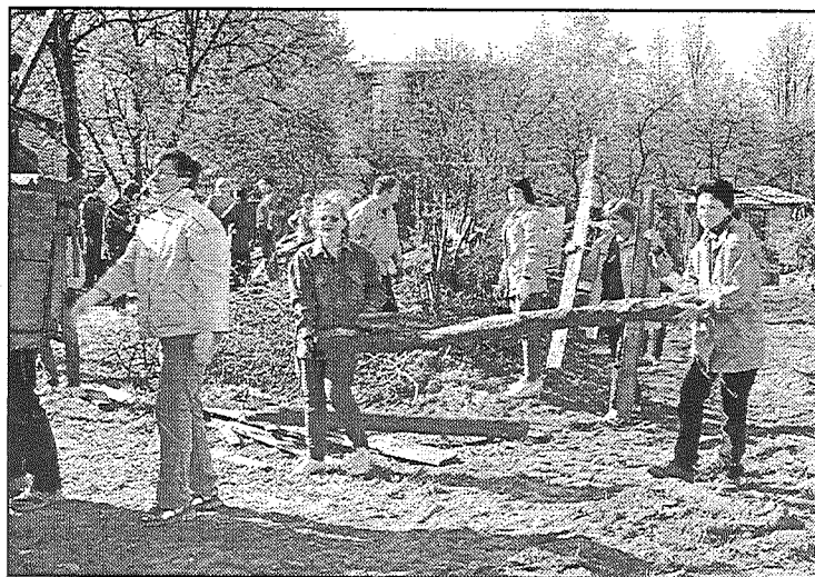
● Talkā pie kultūras nama prelieši pierādīja, ka zina, kādām jābūt istām talkām — ar baļķu nešanu.

Novāktas savu mūžu nokalpojumu šķūniņu atliekas, akmeņi, koki un krūmi, nolīdzināts laukums aiz kultūras nama, kāds bija talkas rezultāts, uz ko Darba svētkos — 1. maijā iedzīvotājus aicināja Preiļu novada dome un kultūras centrs. Talkā piedalījās vairāk nekā pussimts cilvēku, galvenokārt kultūras iestāžu darbinieki, kā arī pašdarbnieki, domes pārstāvji un p.u. «Saimnieks» jaudis ar uzņēmuma tehniku. Kultūras namā pašlaik notiek remontdarbi, un ir cerības, ka pirms septiņiem gadiem griestu iebrukšanu piedzīvojušais toreizējais rajona kultūras nams atkal atgūs dzīvību.