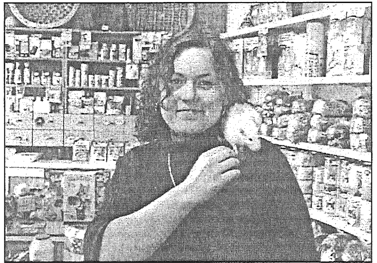
● Dekoratīvās žurkas labprāt uzturas cilvēka tuvumā.

Iegādājoties mājdzīvniekus, jāatceras, ka rakstura ziņā tie ir atšķirīgi. Piemēram, žurciņas vairāk uzturas cilvēka tuvumā, bet kāmiņiem jāvelti lielāka uzmanība. Daži baidās no žurkām, taču patiesībā žurkas ir ļoti gudri dzīvnie-