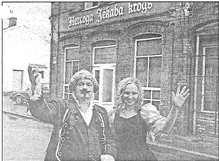
● Atklāt «Hercoga Jēkaba krogu» bija ieradies arī pats hercogs Jēkabs. Viņš radījās apmierināts, ka pilsētā rasta vieta vēl vienam krogam un viesnīcai, tātad Jēkabpils kļūst viesmīlīgāka.