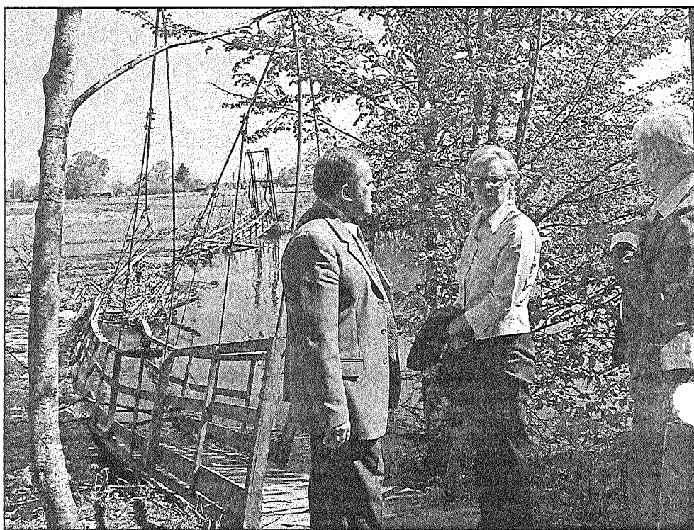
● Saeimas priekšsēdētāja Ingrīda Ūdre (attēlā vidū) par plūdus nodarītajiem zaudējumiem pārliecinājās arī Rožupē, kur Dubna nopostījusi gājēju tiltu.

Ingrīda Ūdre atzina, ka redzētais, kad zemnieki un pašvaldības saviem spēkiem nevar tikt galā ar lielajiem zaudējumiem, liek viņai pārdomāt finansēšanas sistēmas efektivitāti. Pašvaldībām rodas problēmas ar ceļu uzturēšanu, nav naudas plūdus izskaloto ceļu posmu un tiltu