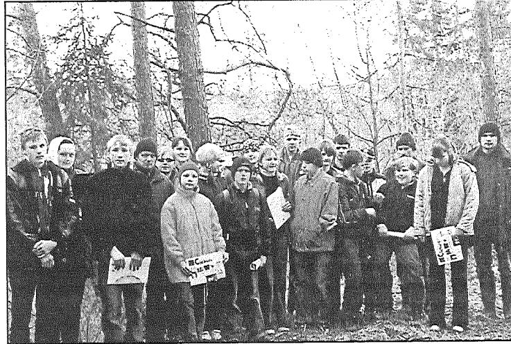
● Pelēču pamatskolas 7. un 8. klases skolēni Borovkas pilskalnā uzzināja daudz jauna un interesanta par šīs vietas seno un notikumiem bagāto vēsturi.

dalībnieki dalījās zināšanās, uzskatīja teritoriju un labā noskaņā pasēdēja pie ugunsкура, atbildot uz Preiļu mežniecības darbinieku sagatavotajiem jautājumiem.