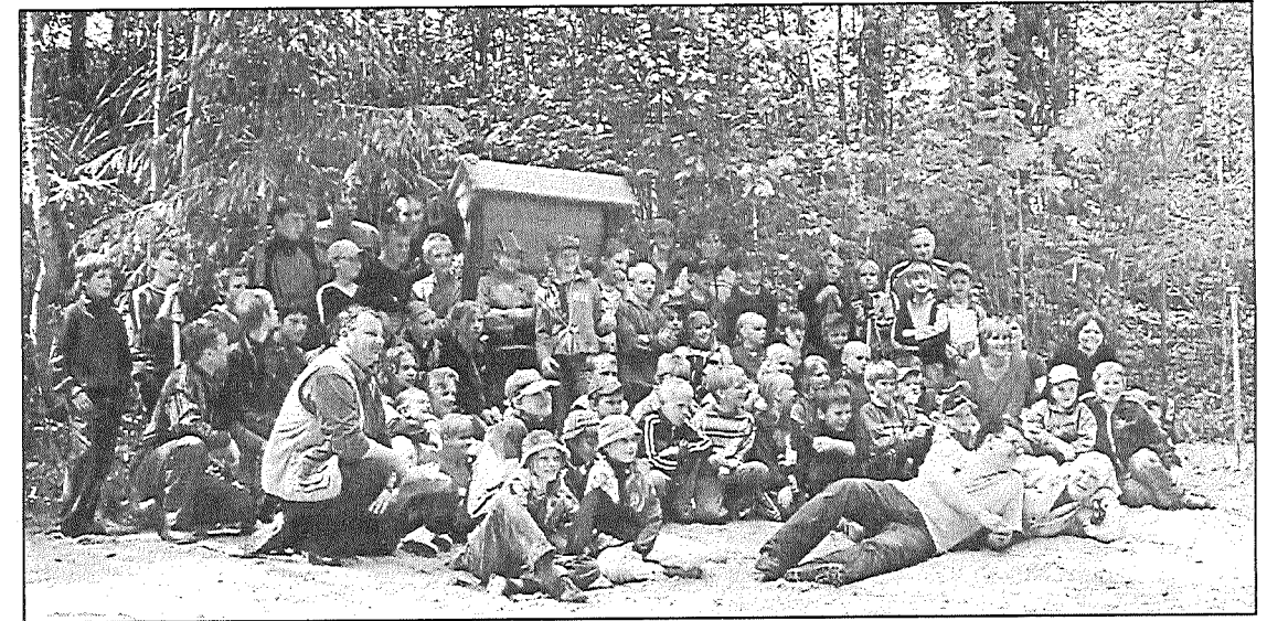
● Galēnu pamatskolas audzēkņi un pedagogi meža dienu noslēgumā Indānu gravas sākumā, kur izveidots stends.