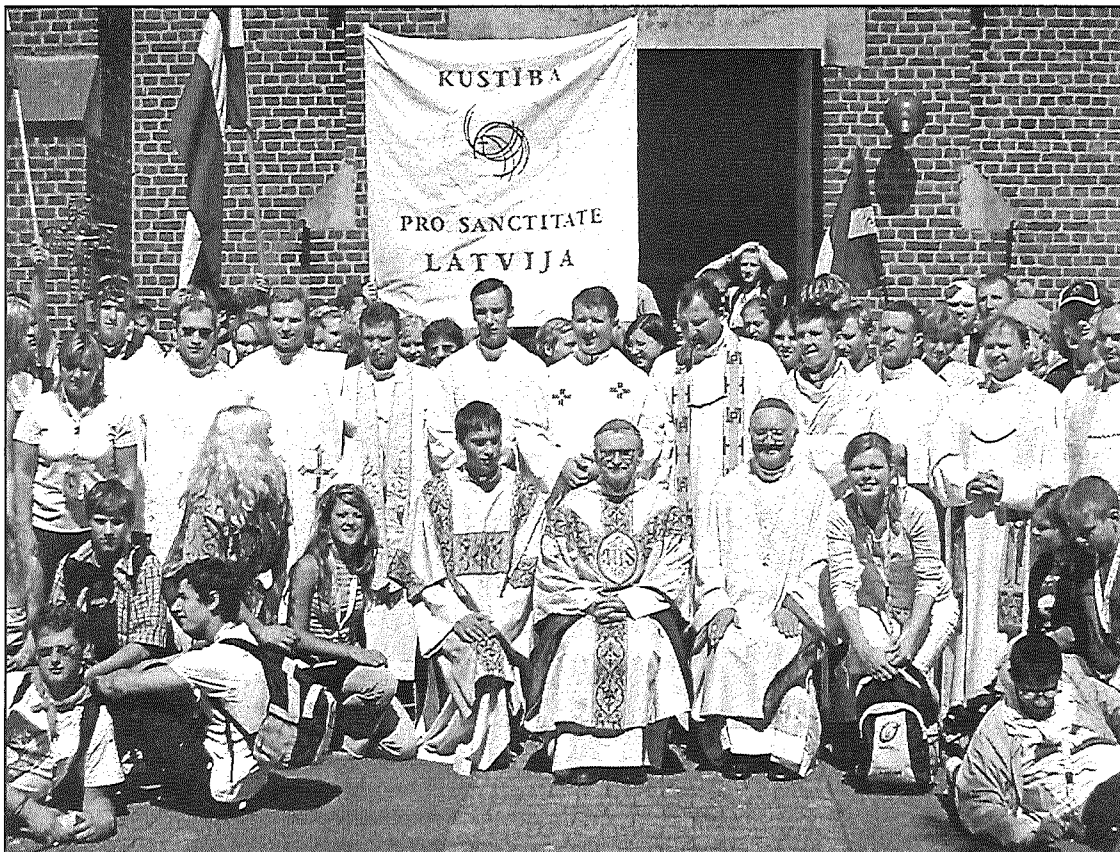
● Latviešu jauniešu grupa pie Svētā Jozefa baznīcas Diseldorfā kopā ar priesteriem un kardinālu Jāni Pujatu pēc viņa vadītās Svētās Mises.

Lai nokļūtu Ķelnes ārpusētas laukumā Marienfeldā, nācās iet kājām astoņus kilometrus ar smagām mugursomām plecās. Nakti svētceļnieki pavadīja šajā laukā zem klajas debess. Tomēr tas ne-