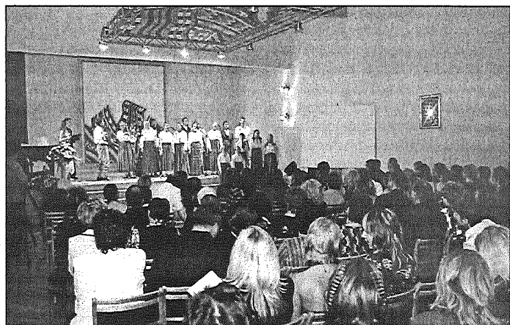
● Livānu 1. vidusskolas 85. jubilejas sarīkojums un absolventu tikšanās bija pirmais pasākums izremontētajā sarakojumu zālē.

T.Elste, bijusi Livānu 1. vidusskolas audzēkne