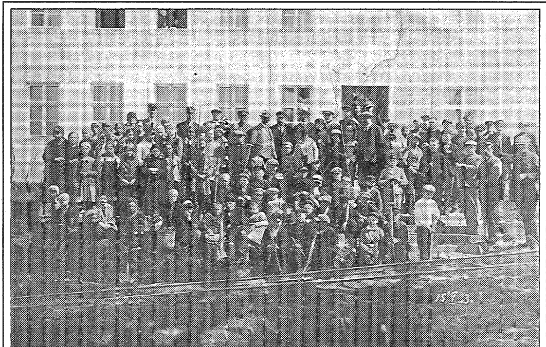
● 1933. gada 15. maijs. Kādam pasākumam par godu pie «Baltās skolas» ir pulcējušies līvānieši. «Novadnieks» lūdz atsaukties iedzīvotājus, kas atceras fotogrāfijā fiksēto notikumu. Zvaniet pa tālr. 5307059. Atcerēsimies vēsturi kopā.

Ceturtdien, 5. oktobrī, Līvānos durvis vēra pašvaldības izveidotais inženiertehnoloģiju un inovāciju centrs (Domes ielā 3, Līvānos), kas tapis ar ES Phare programmas un valsts atbalstu uzņēmējdarbības attīstībai, informē sabiedrisko attiecību speciāliste Līvānu novada domē Ginta Kraukle.