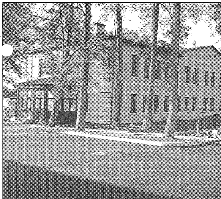
● 2006. gada 5. oktobris. «Baltā skola» atdzimst jaunā veidolā.