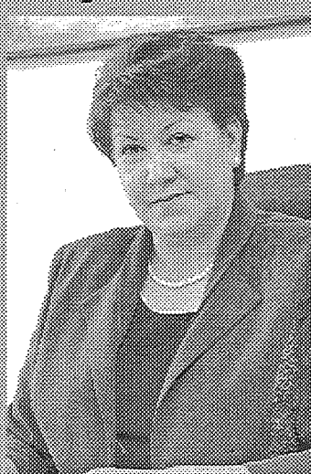
Dagnija Staķe, labklājības ministre:

Esam panākuši, ka apmēram 30 000 pensionāriem, kas strādāja no 2000. līdz 2002. gadam, no 2007. gada 1. janvāra tiks atmaksāta ieturētā pensiju daļa.