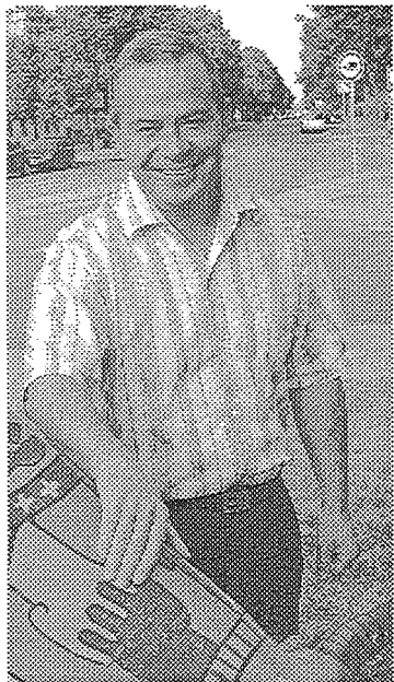
Aivars Lembergs, Ventspils domes priekšsēdētājs, Zaļo un Zemnieku savienības Ministru prezidenta amata kandidāts

Ir pienākušas 9. Saeimas vēlēšanas, un daudzi no mums dosies balsot. Tas ir ļoti atbildīgs un valstisks notikums – vēlēšanas, jo tauta izvēlas tos, kuri nākamajos četrus gadus vadīs valsti un kuru ziņā būs iedzīvotāju labklājība un tautsaimniecības izaugsme. Diemžēl tagad daudzi vairs neiet uz vēlēšanām, tām ir atņemts ar roku. Vieni neiet tāpēc, ka ir vienaldzīgi, citi – tāpēc, ka zaudējuši