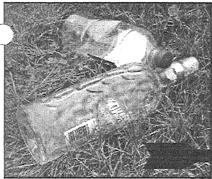
Nezināmas izcelsmes alkoholu dzēruši — ?