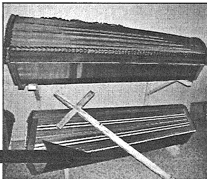
Miris — 1