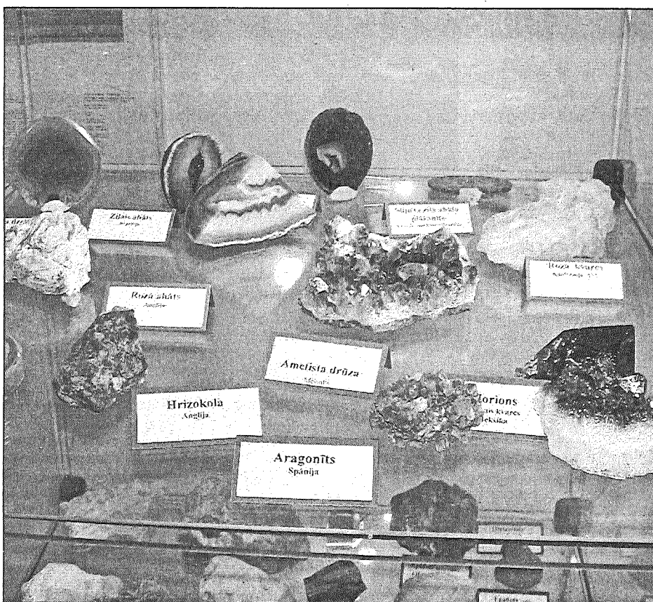
● Ko slēpj zemes dzīles? Skats no derīgo izrakteņu izstādes Jaunmoku pili.

Minerālūdeņi plaši pētīti 80. gados, ieguve notika Siguldā, Cēsis, Piltenē un Rīgā. Zinātnieki uzskata, ka to kvalitāte ir augstāka nekā importētajiem. Un vēl ir atradnes Rojā, Ragaciemā, Piltenē, Liepājā, Jaunķe-