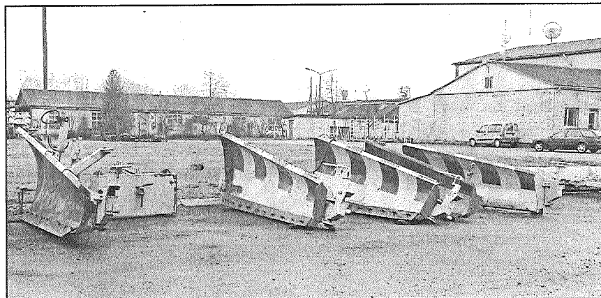
● Pagaidām sniega tīrīšanai paredzētās lāpstas vēl nav izmantotas. Nez, kur kavējas Sniega māte.

Šogad atvēlēts vēl vairāk līdzekļu — 1 miljons 90 tūkstoši latu. Tomēr šis finansējuma pieaugums ir kā piliens jūrā, lai braukšanas apstākļus uzlabotu, nepieciešami daudzkārt lielāki ieguldījumi, — secina rajona nodaļas vadītājs.