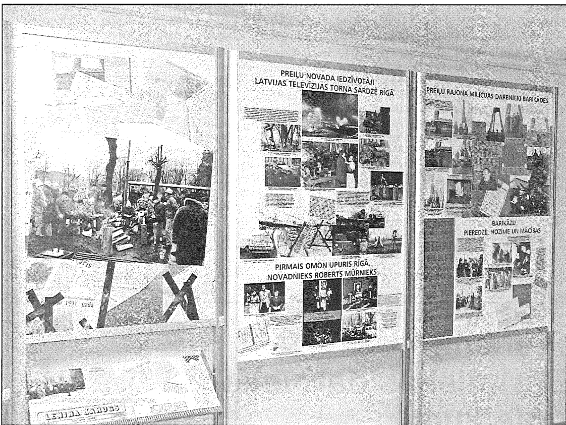
● Izstāde «Janvāra barikāžu vēsture un mācības» Preiļu rajona galvenajā bibliotēkā ikvienam skatītājam atgādina svarīgo posmu Latvijas neatkarības atgūšanā.

Rajona galvenajā bibliotēkā pašlaik skatāma Preiļu vēstures un lietišķās mākslas muzeja sagatavotā izstāde «Janvāra barikāžu vēsture un mācības». Izstādes materiāli atsauc atmiņā 1991. gada notikumus, kad no visām Latvijas pilsētām un pagastiem iedzīvotāji devās uz Rīgu apsargāt val-