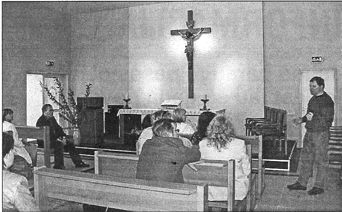
● Vienkārši un atturīgi – tā izskatās Ādažu militārās bāzes kapelā.

Ādažos dien apmēram pusotrs tūkstoši profesionālu speciālistu. — Latvijas armija ir jauna, svaiga un pozitīva, — tā virsleitnants