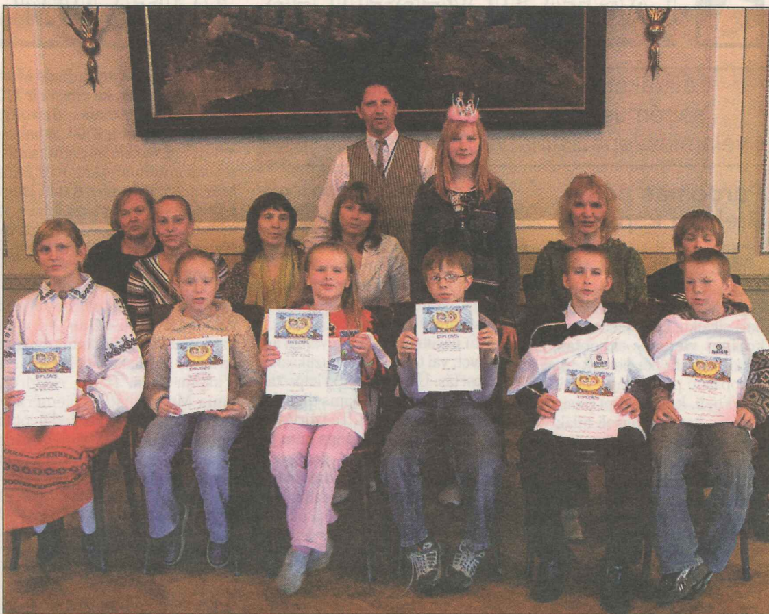
● Preiļu rajona labākie rotaļnieki kopā ar savām skolotājām konkursa noslēgumā.