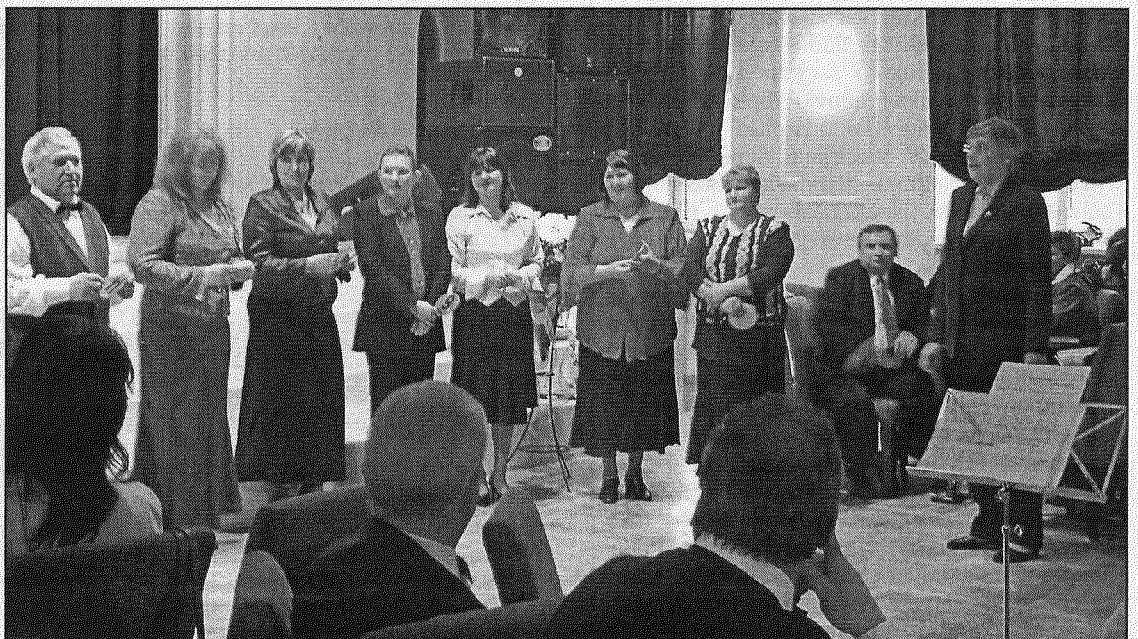
● Vokālo ansambļu vadītāji un pārstāvji pēc sadziedāšanās saņēma pārsteiguma balvas un pateicību par paveikto.

Ansamblī klausītājus iepriecināja ar daudzām dziesmām, bet visvairāk aplausu izpelnījās Preiļu vīru un Aglonas dāmu kopīgā uzstāšanās. Ansamblis «Virši» 21. aprīlī piedalīsies Latvijas senioru vokālo ansambļu konkursā Aizkrauklē. Lappusi sagatavoja L.Rancāne