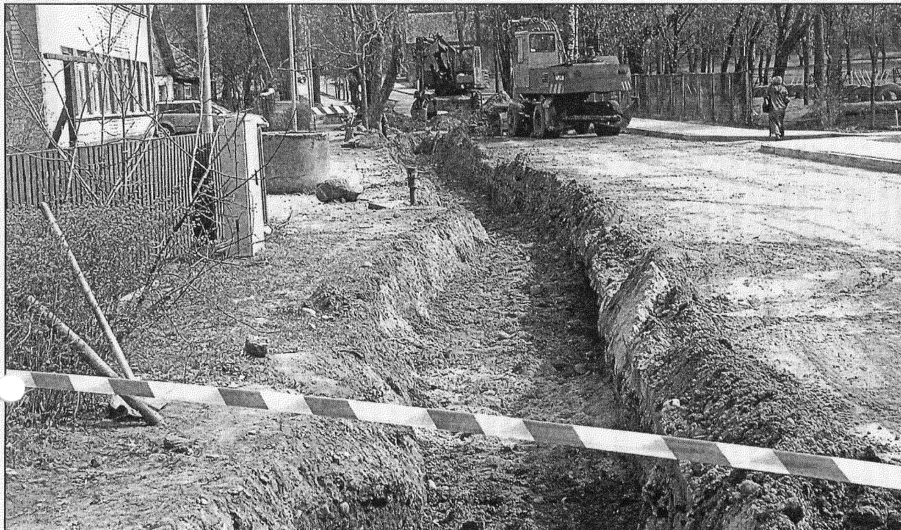
● Viena no piecām celtnieku būvbrigādēm veic ūdensvada izbūvi A.Paulāna ielā. Arī šī iela no Raiņa bulvāra līdz krustojumam ar Daugavpils ielu pašlaik slēgta transporta kustībai.