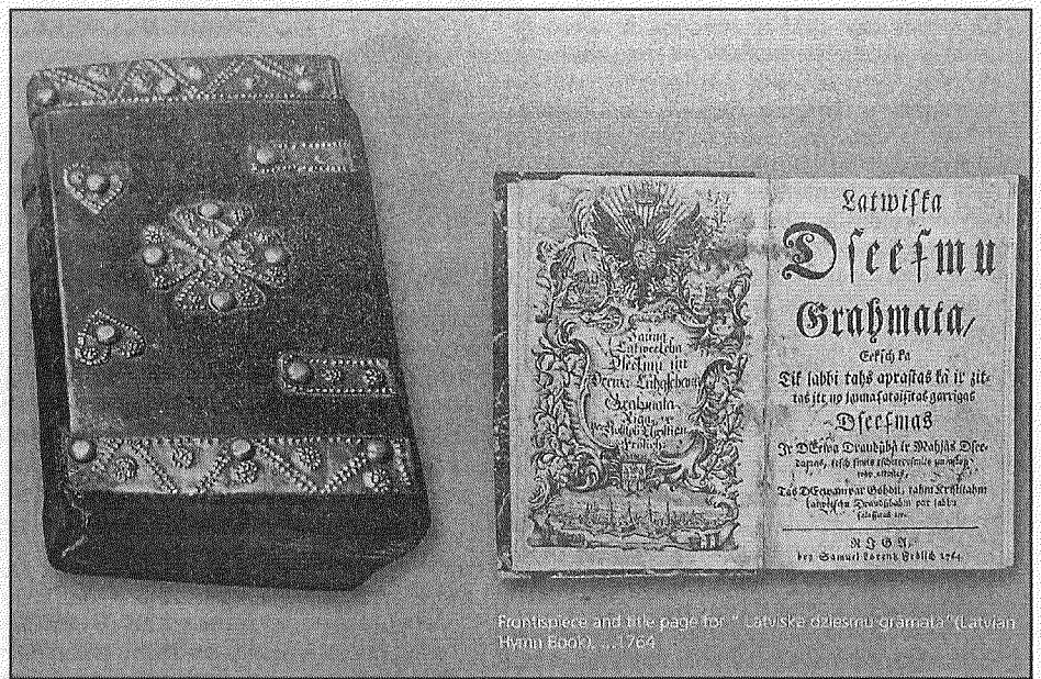
Frontispiece and title page for "Latviešu dziesiņu grāmata" (Latvian Hymn Book), 1764

Latvija var lepoties ar J.Rozentāla, G.Škil-