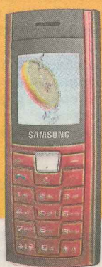
Samsung C170 Ls 0,03