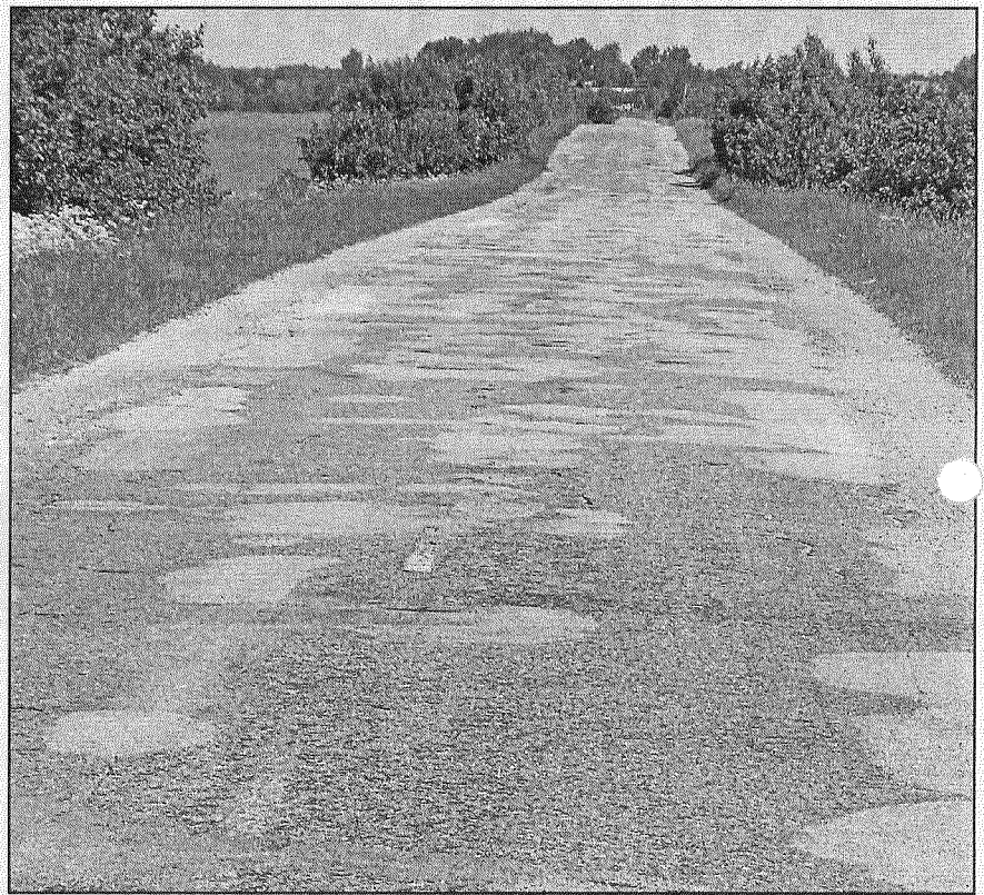
● Tas nav ielāpains lupatu dekis, bet gan ceļš no Korsikovas līdz Aizkalnei. Šis ceļa posms bija iekļauts rajona padomes prioritāri remontējamu ceļu sarakstā, taču finansējuma jaunam asfalta klājumam nav.

Satiksmes ministrijas valsts sekretārs skaidro, ka programma otrās šķiras au-