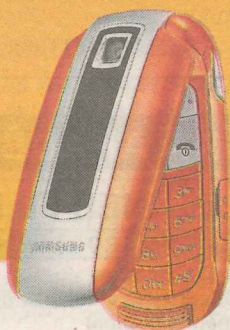
Samsung E570 Ls 19

Kļūstiet par BITES klientu līdz 24. jūnijam un saņēmiat 2000 bezmaksas minūtes sarunām.