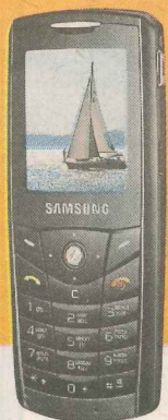
Samsung E200 Ls 9