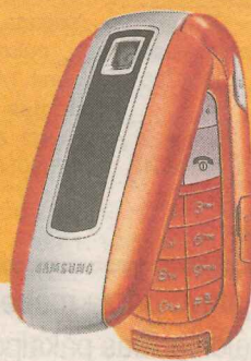
Samsung E570 Ls 19

Kļūstiet par BITES klientu līdz 24. jūnijam un saņemiet 2000 bezmaksas minūtes sarunām. Iegādājieties arī stilīgus Samsung tālruņus, sākot no Ls 0,03.