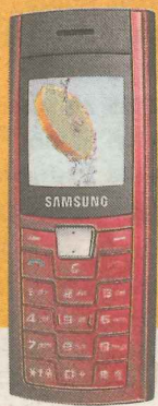
Samsung C170 Ls 0,03