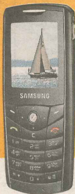
Samsung E200 Ls 9