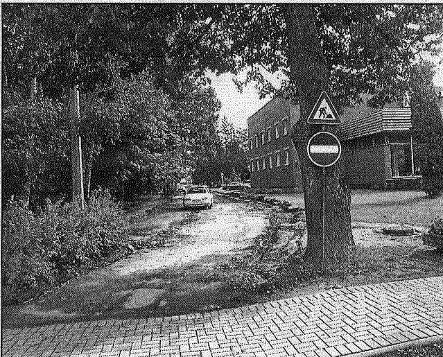
● Talsu ielas turpinājuma rekonstrukcija no Raiņa bulvāra līdz Liepu ielai jau uzsākta. Paredzēts izbūvēt brauktuvi, kas Raiņa bulvāri savienos ar Liepu ielu. Pagaidām gan šķiet, ka krustojums sanāks iešķībs, ja vien ielas malā augošo pamatīgo liepu nenozāgēs.

(kopā nedaudz mazāk par 80 tūkstošiem latu). Līgums par darbiem noslēgts ar firmu