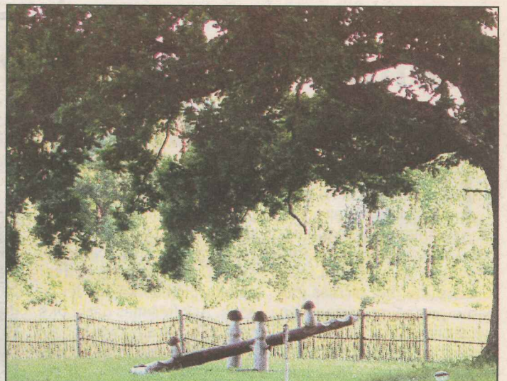
● «Ozolkalnu» lepnums ir simtgadīgie ozoli. Vareni tie slej zarus pret debesīm, uzņemdami gan saules gaismu, gan zibens šķēpus negaisa laikā.