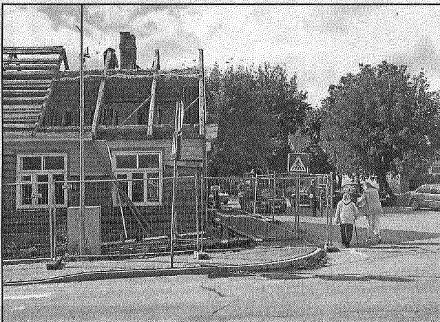
● Pēc Aglonas un Liepu ielas krustojuma rekonstrukcijas darbu pabeigšanas gājēju ietve paredzēta vietā, kur pašlaik vēl atrodas demontējamā ēka. Līdz ar to krustojums būs plašāks, pārredzamāks un autovadītāji varēs drošāk veikt pagriezienu manevrus.

Arī šis projekts tiek īstenots par Eiropas Reģionālās attīstības fonda līdzekļiem ar pašvaldības līdzfinansējumu