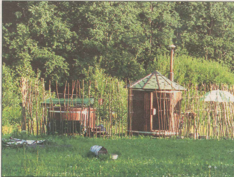
● Latgalē šāda miniatūra pirtīņa ar turpat līdzās novietotu aukstā ūdens baļņu nevienā viesu mājā nav manīta. Tiesa, būvēšana izmaksājusi apaļu summu, bet ieguldītā nauda ir to vērtā.