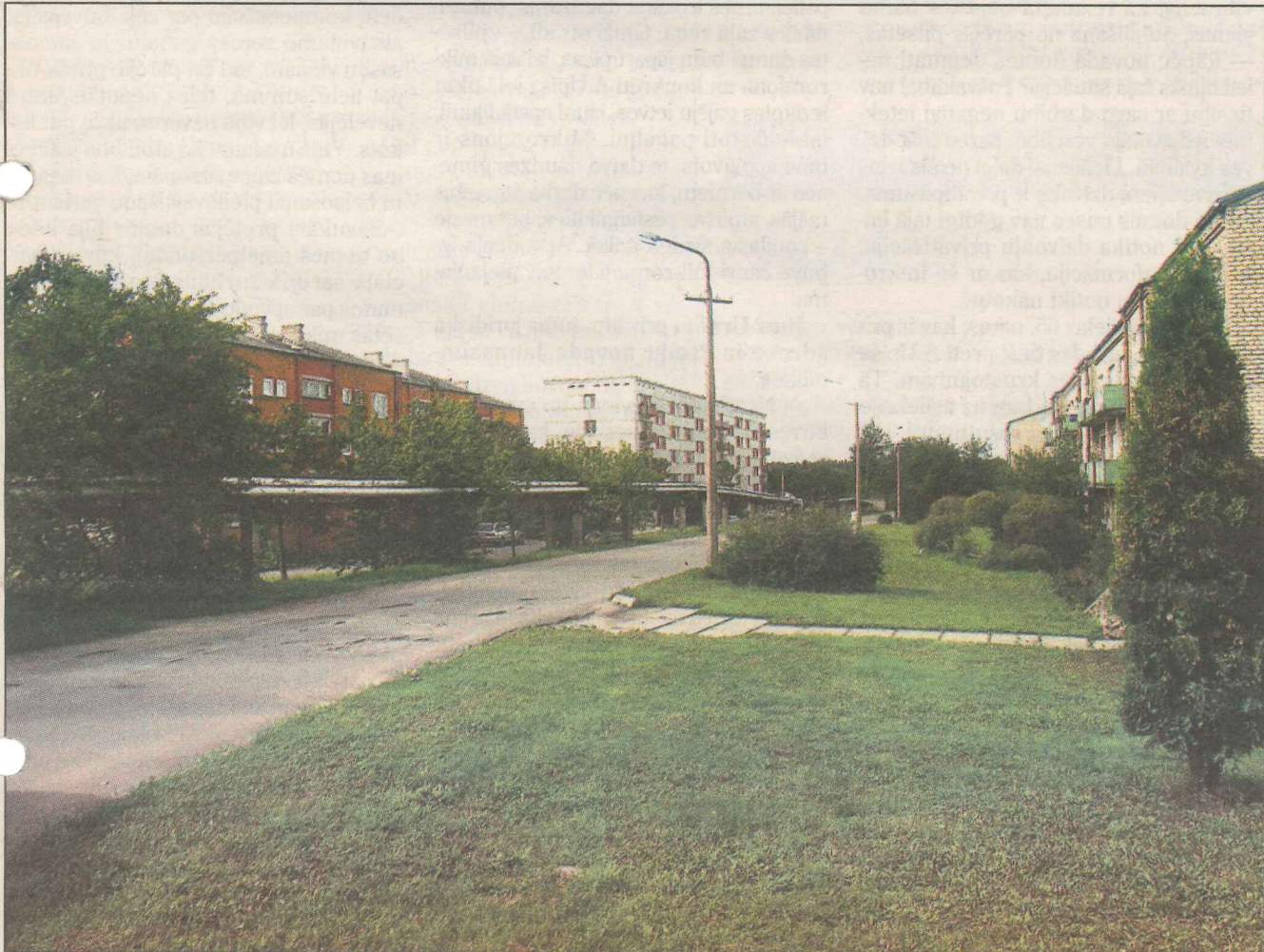
● A.Upiša ielas likteni pāris minūšu laikā izlēma seši Preiļu novada domes deputāti, 31. augustā nobalsojot, ka šeit tiks uzbūvēts apvedceļš.