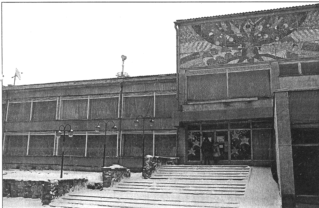
● Riebiņu novada Riebiņu kultūras nama (attēlā) remontam piešķirta dotācija 81 000 latu apmērā.

Televizijas programma 14. – 20. janvāris