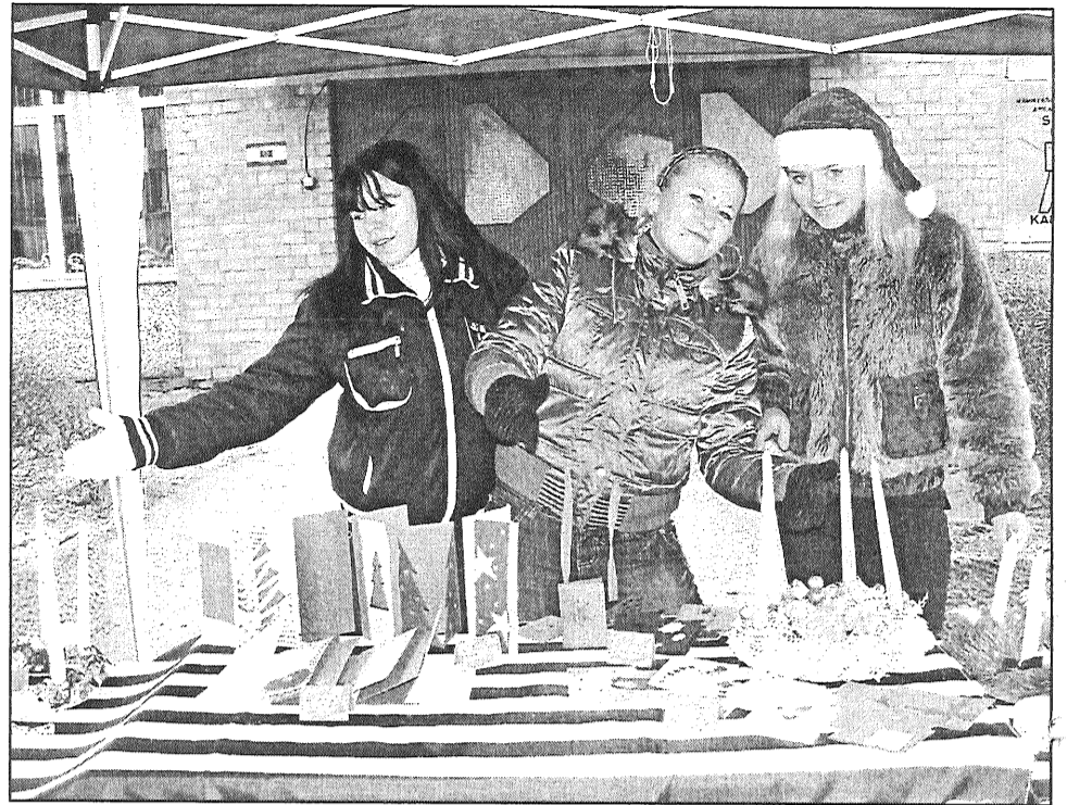
● Vienā no Motivācijas skolas nodarbībām jaunieši organizēja pirmssvētku tirdziņu ar pašu gatavotām mantiņām.